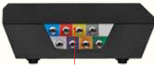
CONEXIONES DE GAS