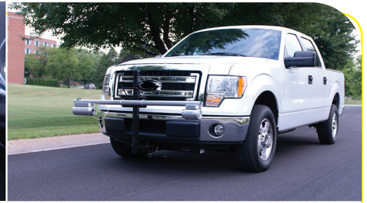
Altura ajustável para velocidades de condução seguras.