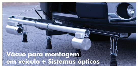
Vácuo para montagem em veículo + Sistemas ópticos