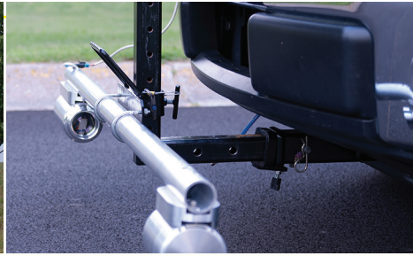
Projetado para fácil instalação e portabilidade.