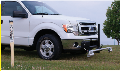
Listo para estudios de carreteras y cualquier terreno.