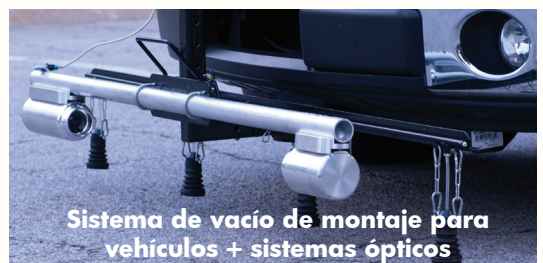
Sistema de vacío de montaje para vehículos + sistemas ópticos